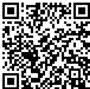
SportsLists LITE mobile App. Available for iOS and Android

Eine Veröffentlichung der vorläufigen Meldeliste (mit bezahlten Meldungen) erfolgt jeweils 24 Stunden nach Online-Meldeschluss auf https://sportslists.eu/results/select/live